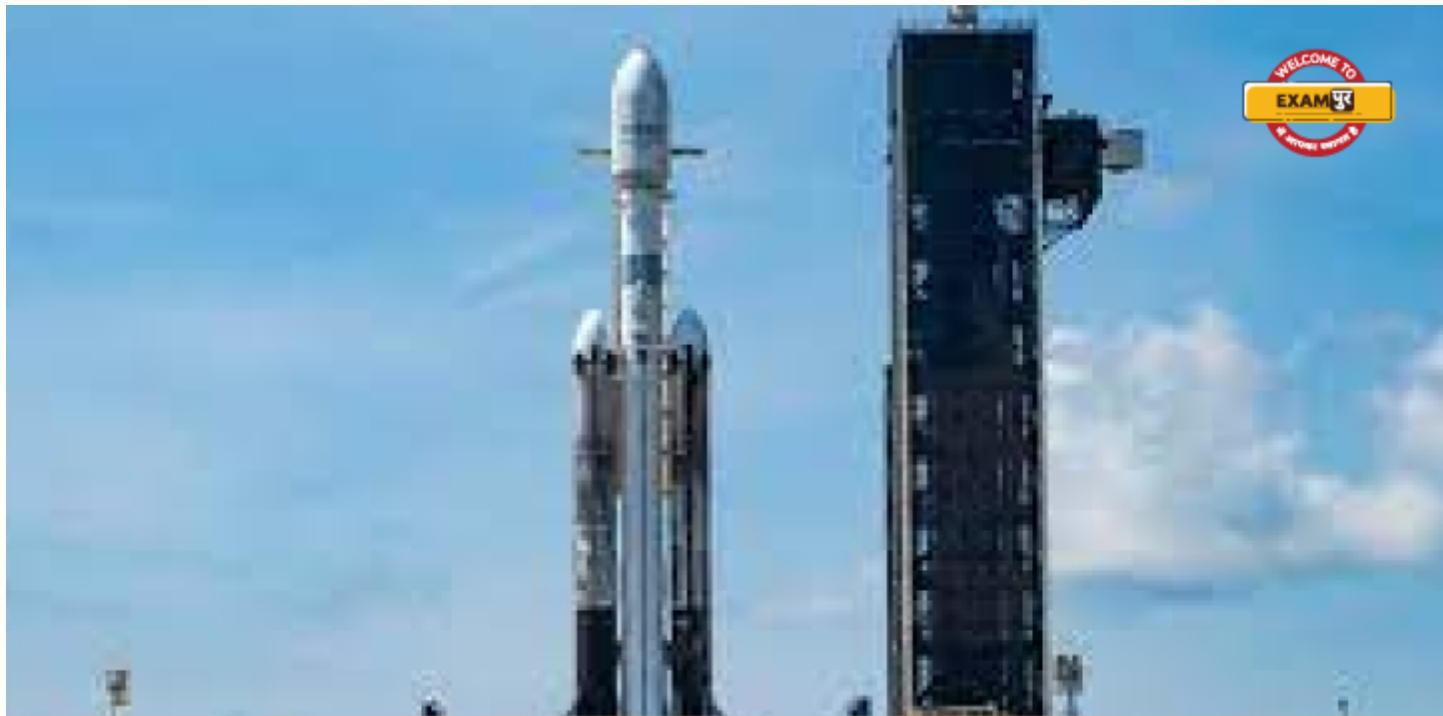
SpaceX launches 'Jupiter 3', world's largest private communication satellite